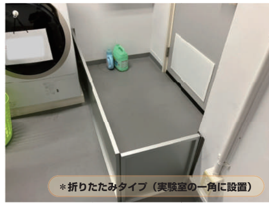
* 折りたたみタイプ（実験室の一角に設置）