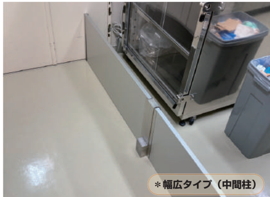
* 幅広タイプ（中間柱）