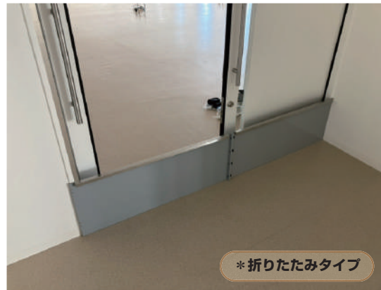
* 折りたたみタイプ