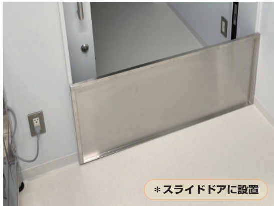
* スライドドアに設置

設置場所(実験室、飼育室等)の条件・寸法・形状に応じてユーザー様ごとに、使い勝手の良いネズミ返しを製作いたします。